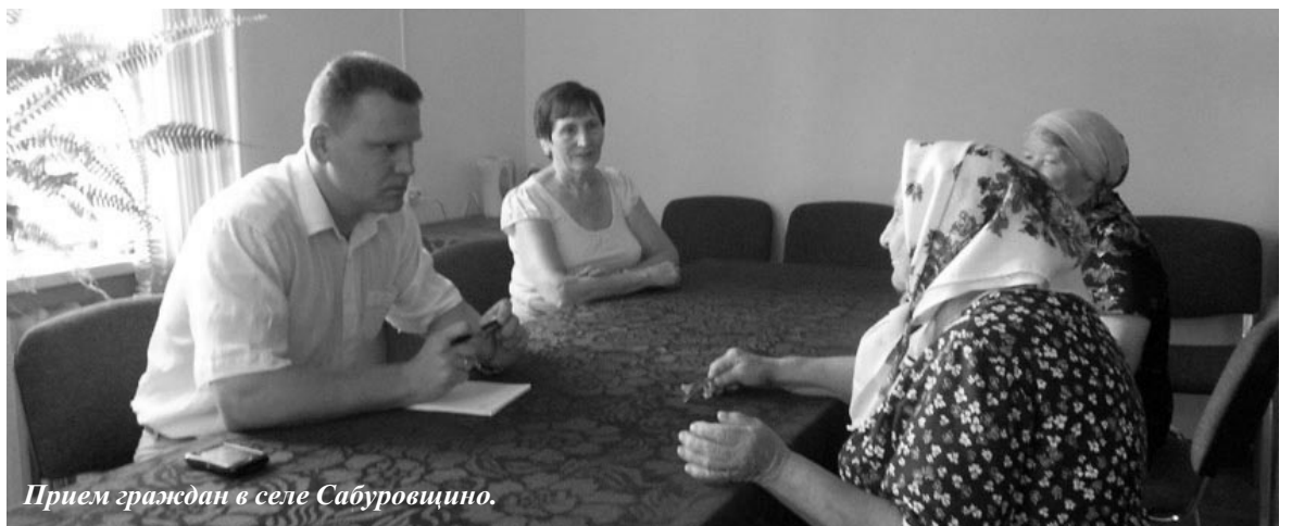
Прием граждан в селе Сабуровщино.